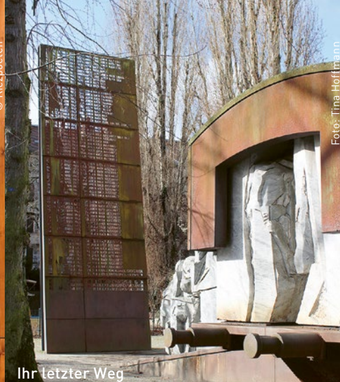
Ihr letzter Weg