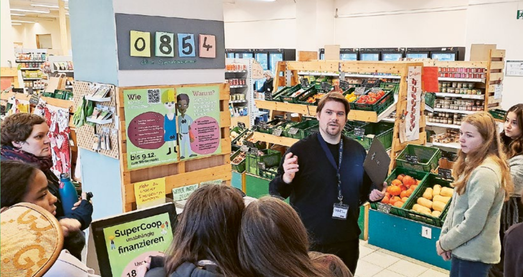
Exkursion zur Genossenschaft SuperCoop in Berlin-Wedding

Genossenschaft – die erfolgreiche Unternehmensform